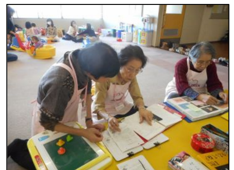
〈おもちゃの貸し出し状況を確認中〉