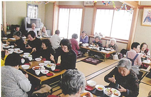
ふれあい給食会の様子