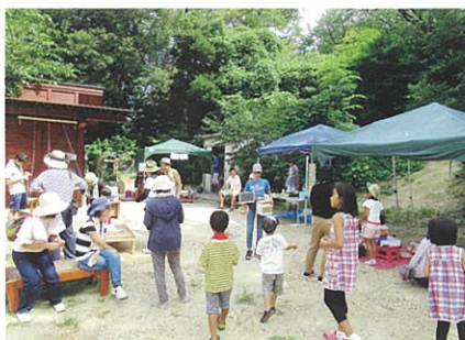
子どものまちな様子

子どもや子育てを支える環境づくりを目的として、子ども・子育て支援に必要な知識や技術を学ぶための講座等を開催し、新たな支え手の養成や多様な主体の参加、現活動者の資質向上が期待できる事業の支援