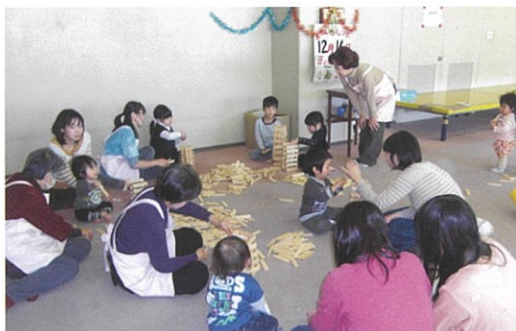
おもちゃ図書館の様子