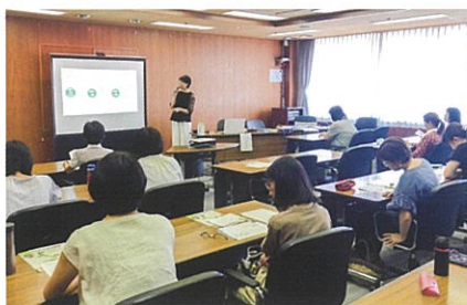
子育て支援の担い手養成講座の様子