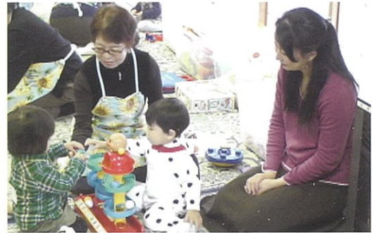
子育てサロンの様子

小学校区にある地域福祉推進協議会が実施する、高齢者等のふれあい給食会、世代間交流事業、見守り活動等の支援