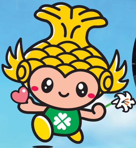
名古屋市社会福祉協議会マスコットキャラクター 「な～や」