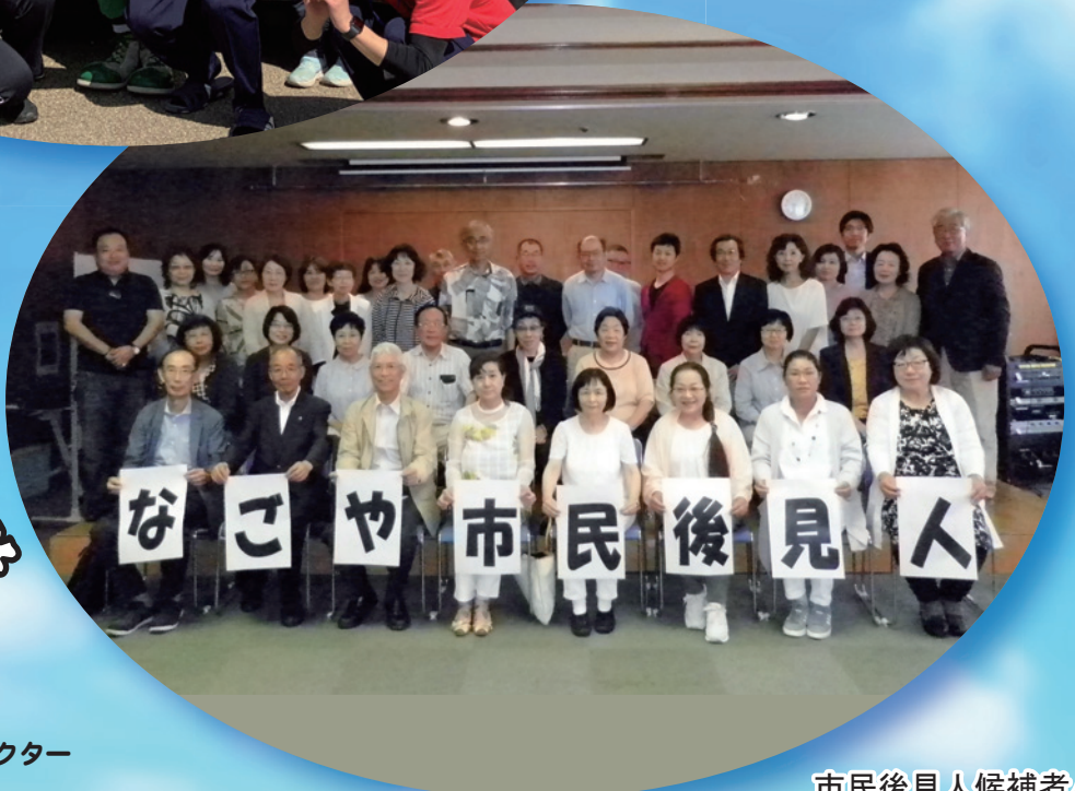
市民後見人候補者バンク 登録の皆さん