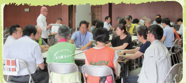
災害時のボランティア活動支援 「行政やボランティア等との災害ボランティアセンター設置・運営研修」

区社会福祉協議会ボランティアセンターの機能強化と横の連携を図るため、連絡調整、情報提供、研修の開催などの支援を行っています。