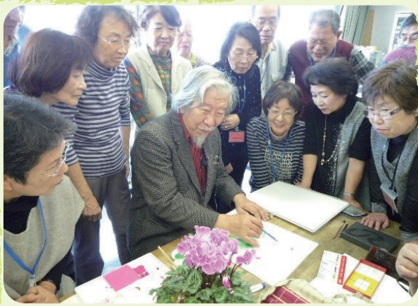
鯉城学園授業風景