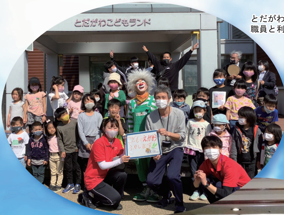
とだがわこどもランド 職員と利用者の皆さん