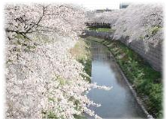
2.5km 続く山崎川沿いの桜並木