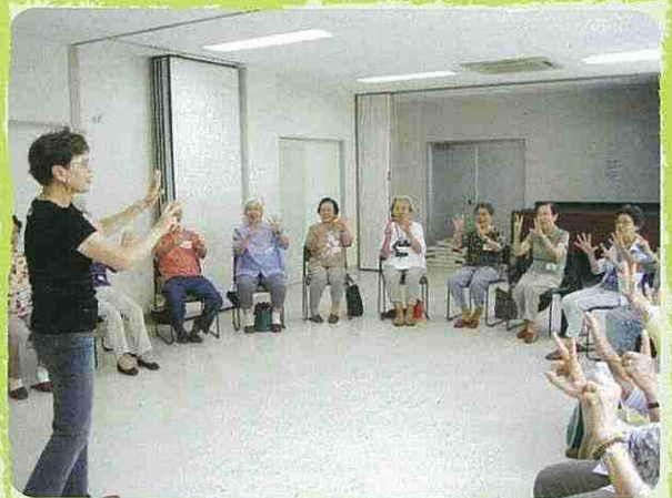
高齢者はつらつ長寿推進事業

契約型の第三者委員共同設置機関として、福祉施設（契約事業所）のサービス利用者から、苦情の申立や相談を受け付け、円滑・円満な苦情の解決を支援します。