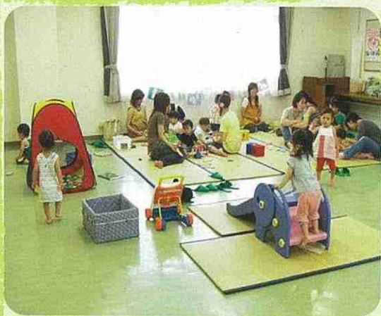
子育てサロン活動

地域福祉活動の財源として、市民の寄付等を積み立て、その基金の果実（利息）と寄付金により、市民参加の社会福祉の推進を図っています。