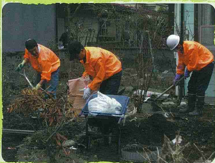
災害時のボランティア活動支援