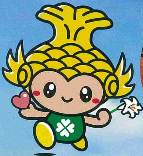
名古屋市社会福祉協議会マスコットキャラクター 「な〜や」