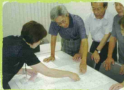
地域福祉推進協議会活動 (地域支えあい) マップづくり

市内9区の社会福祉協議会が、身近な地域でくつろげる場の提供となるよう実施している通所介護事業（デイサービス）を支援しています。