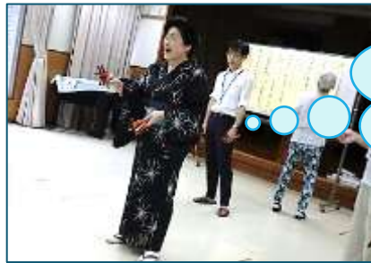
↑民踊の日の様子。鳴子おどりを先生に教えてもらっています。

施設の利用者さんもサロン参加者さんも、踊りや人とのふれあいを通じて笑顔になってほしい、と民踊の先生。施設職員さんが一緒に盛り立ててくれるので嬉しいとのこと。