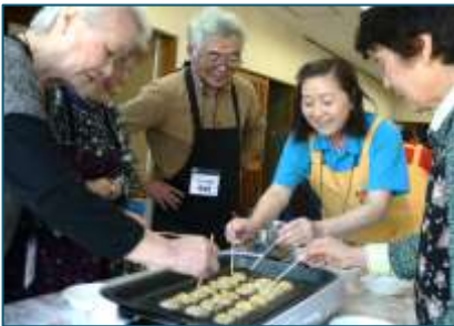
↑おかしづくりの日のたこ焼きの様子。おかしづくりは地域のボランティアも協力しています。