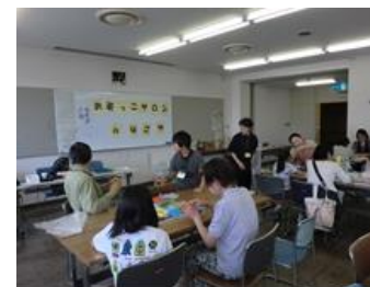
第34回(平成27年5月23日(日)) * 好きな香りでアロマ小物づくり *場所：市総合社会福祉会館(北区) (参加者：3世帯 8名)