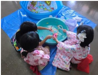
第37回(平成27年8月23日(日)) ♪ 夏祭りとウクレレ体験 ♪ 場所：市総合社会福祉会館(北区) (参加者：8世帯 20名)

毎号「お知らせ」でご案内を掲載している「お茶っこサロンなごや」。直近4回の当日の様子をお知らせいたします。いろいろなプログラムを用意していますので、ご興味のある時にはお気軽にご参加ください！