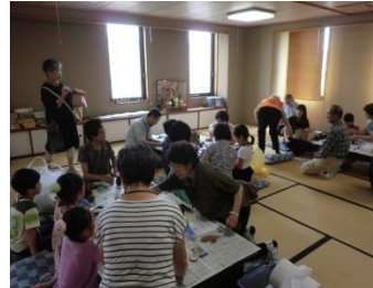
第36回(平成27年7月12日(日)) ☆ どんぐりや松ぼっくりでの工作 ☆ 場所：三菱電機名古屋製作所体育館内和室(東区) (参加者：7世帯 12名)