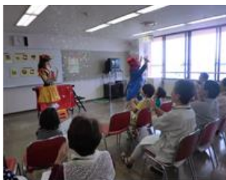
第35回(平成27年6月27日(土)) ◎ クラウンによるマジックやイリュージョン ◎ 場所：市総合社会福祉会館(北区) (参加者：6世帯 12名)