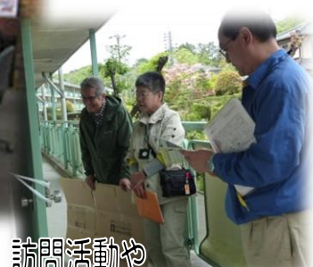
訪問活動や あたたかい気持ちのお届け