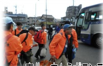
東北へ向かうボランティア支援