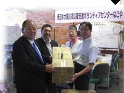
様々な支援物資のご提供