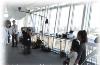
各地で開催された交流会