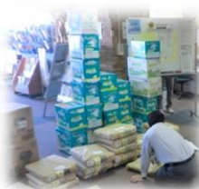
ボランティアさん奮闘中!